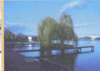
Port de St-Romain des Iles